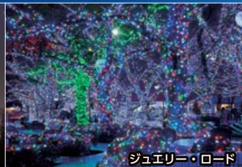
ジュエリー・ロード