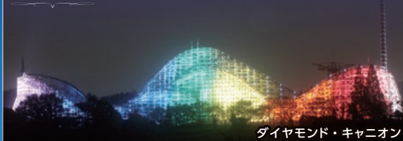
ダイヤモンド・キャニオン