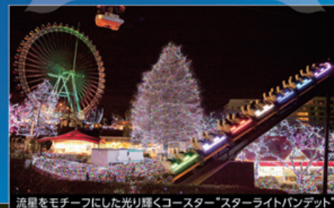
流星をモチーフにした光り輝くコースター“スターライトバンデット”