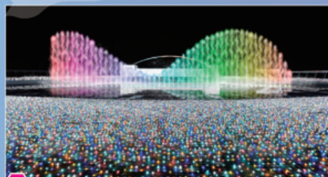
New 高さ15m、横幅60mに設置された噴水による、光と音の大迫力イルミネーションショー“パリ・モナムール”