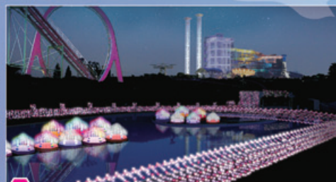
New 新エリア「ラブリーストリームエリア」に、ルビーなど6つの宝石色の組み合わせからなる新色“ラブリージュエリーカラー”