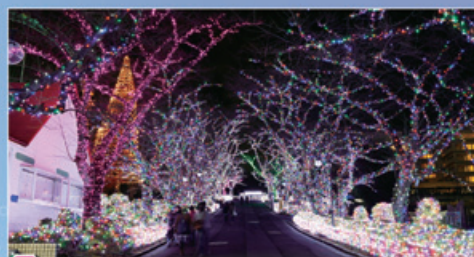
New 新たに光が動く演出を追加! 40万球の宝石色に光るイルミネーションが音楽に合わせて輝く“ジュエリーファンタジー”