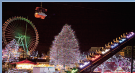
見るだけでなく遊ぶことができるのも遊園地イルミネーションの魅力。都心のパノラマ夜景が一望できる「スターライトバンデット」はオススメ!