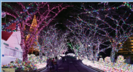
40万球の宝石イルミネーションが音楽に合わせて輝く「ジュエリーファンタジー」。光に包まれる感覚は圧巻です。日没には点灯パレードも開催。