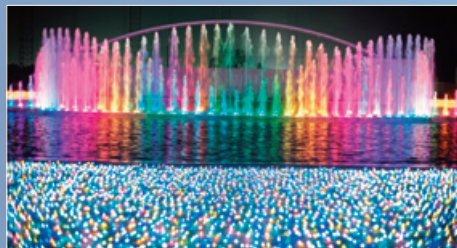
昨年より大好評の噴水ショー。今年は昨年比2倍の規模に拡大。音楽に合わせダイナミックに上がる噴水は必見です。