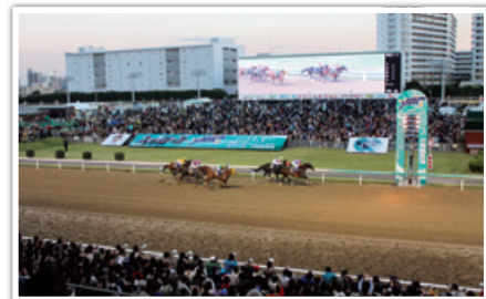
川崎競馬場「JBC競走」開催の様子

11月3日、ダート競馬の祭典「JBC競走」が4年ぶりに川崎競馬場で開催されました。本年は開催日が祝日であったこともあり、2万8千人を超える来場者で賑わい、地方競馬1日総売得金額の新記録を達成しました。なお、「JBC競走」開催に合わせ大規模なリニューアル工事を行い、1号スタンド3階に英国風デザインの来賓室、2号スタンド2階にイベントスペース「カツマルくんホール」、内馬場にはポーネランド監修による「キッズルーム」などを新設いたしました。本年2月にオープンした隣接する商業施設「マーケットスクエア川崎イースト」とあわせ、365日いつでも「競馬観戦、ショッピング、飲食」が同時に可能となり、他に類を見ないレジャーエリアとなった川崎競馬場が、さらに快適な環境で競馬観戦を楽しめるようになりました。