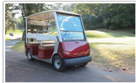
導入予定の乗用カート

東京よみうりカントリークラブでは、ゴルファーの高齢化や近年の夏の猛暑への対策として、平成29年10月より乗用カートの導入を予定しております。クラブ競技やプロのトーナメントに影響を与えないよう、既存のカート道を改修いたします。戦略的な部分を変えることなく、より快適なプレー環境の整備に努めてまいります。