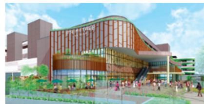
プライムツリー赤池 外観イメージ