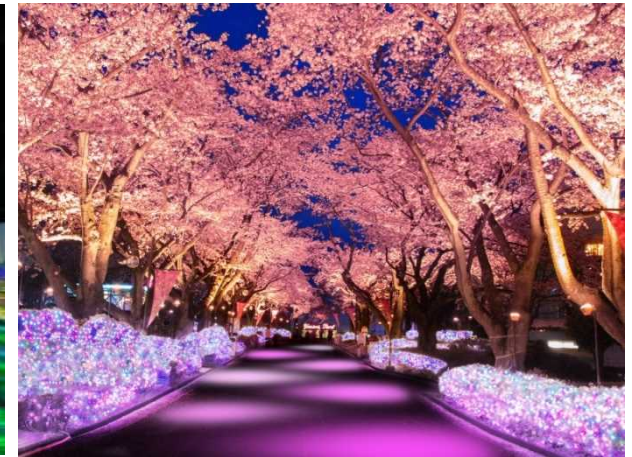
桜並木ライトアップイメージ

公式サイト http://www.yomiuriland.com/jewellumination/