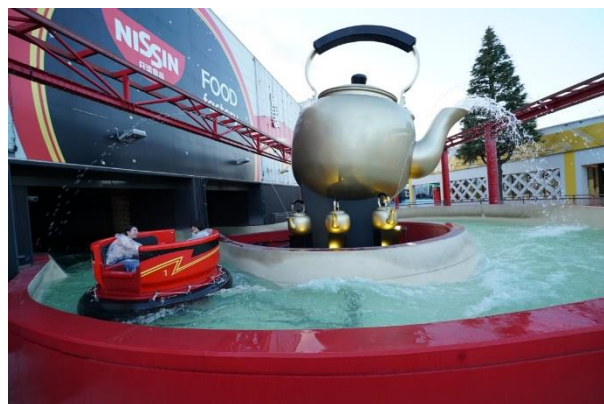
貸出画像「スプラッシュU.F.O. summer ver.」