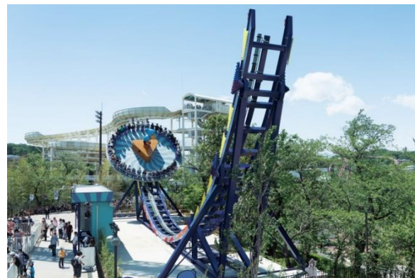
貸出画像「ハシビロSUMMER！」