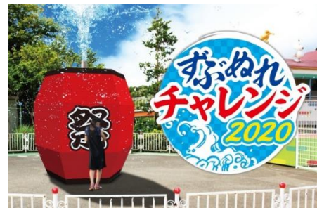
貸出画像「ずぶぬれチャレンジ2020」