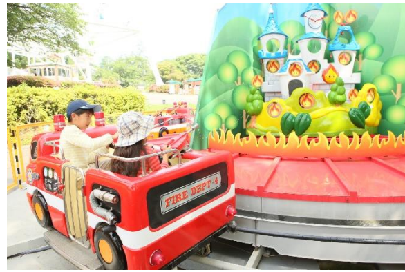
貸出画像「ぬれっぴー」