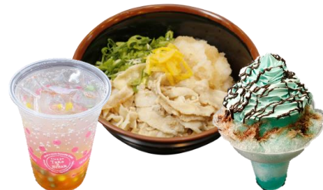
貸出画像「ガッツリvsさっぱり 夏のグルメバトル！」

▼報道関係のお問合せ先 株式会社よみうりランド 広報部 奥谷・西田 〒206-8566 東京都稲城市矢野口4015-1 TEL 044-966-9565(直通) FAX 044-966-9699 Mail y-okutani@yomiuriland.co.jp s-nishida@yomiuriland.co.jp