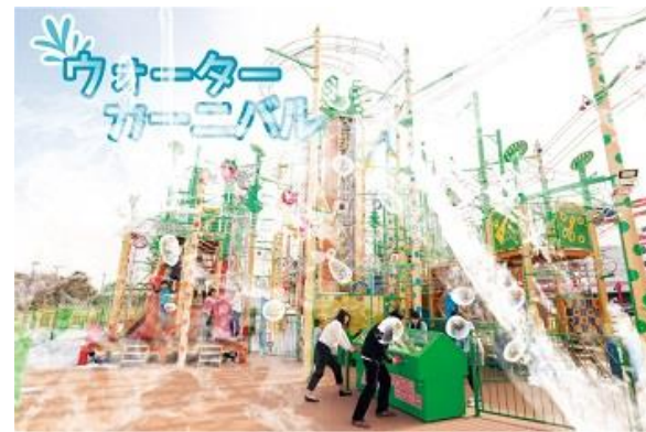
貸出画像「たまごロー ウォーターカーニバル」