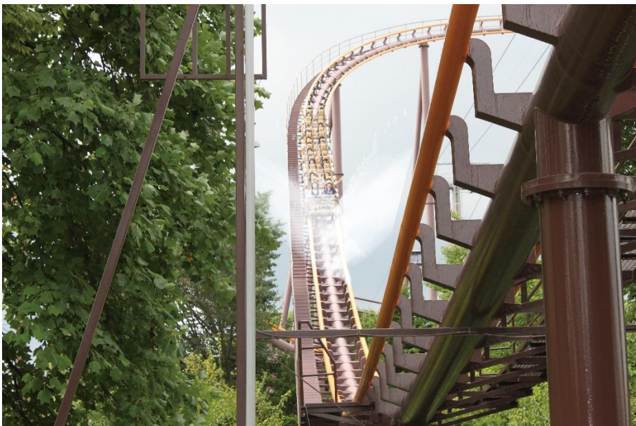
貸出画像「スプラッシュバンデット2020」