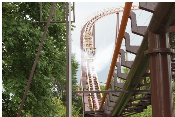
貸出画像「スプラッシュバンデット2020」