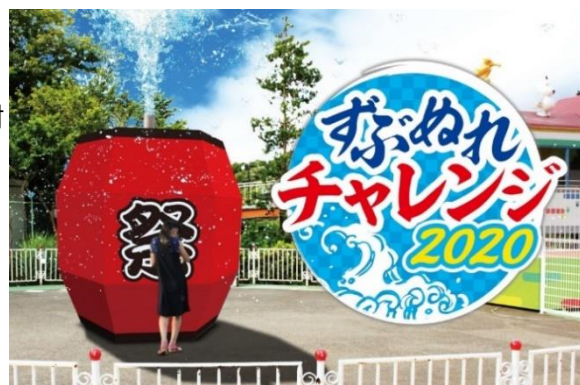
貸出画像「ずぶぬれチャレンジ2020」

みんなで楽しくスッキリ爽快ずぶぬれ体験ができるスプラッシュゲームが登場いたします。会場内にある自販機で飲料1本(160円)を購入して参加。マツト型スイッチを足で踏み、見事当たるとウォーターキャノンから大量の水が発射されます。当たった方は豪華な商品が当たる抽選会に参加ができます。見ている人も楽しめる爽快スプラッシュゲームです。