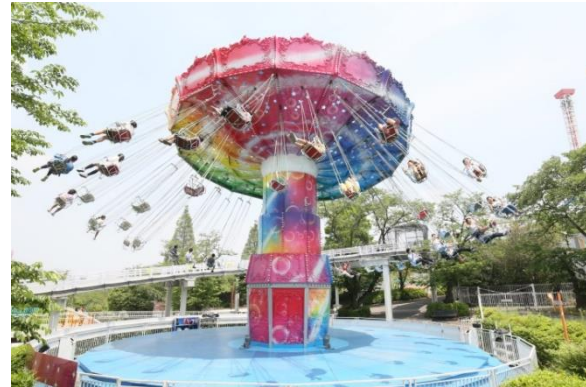
貸出画像「ミスティーウェイ」