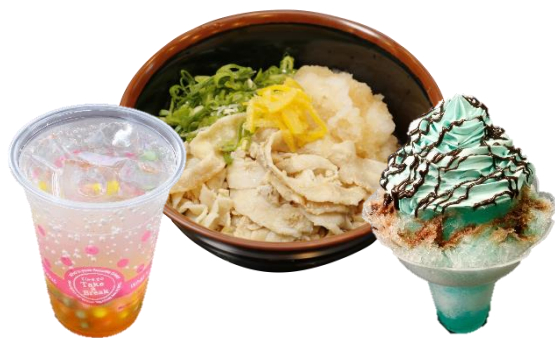
貸出画像「ガッツリvsさっぱり 夏のグルメバトル！」

園内13の飲食売店では、7月23日(木祝)から9月13日(日)の期間、「ガッツリvsさっぱり 夏のグルメバトル！」を開催いたします。夏に相応しいガッツリメニューと涼を感じるさっぱりメニュー計26品を販売いたします。