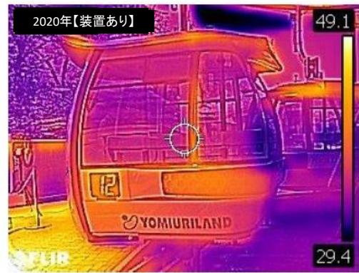
2020年8月16日12:00撮影 運転室外気温36℃ 搬器内部温度36℃

▼報道関係のお問合せ先 株式会社よみうりランド 広報部 奥谷・西田 〒206-8566 東京都稲城市矢野口4015-1 TEL 044-966-9565(直通) FAX 044-966-9699 Mail y-okutani@yomiuriland.co.jp s-nishida@yomiuriland.co.jp