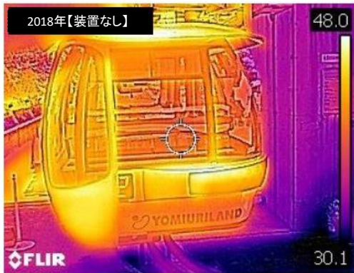
2018年7月23日12:45撮影 運転室外気温38℃ 搬器内部温度42℃