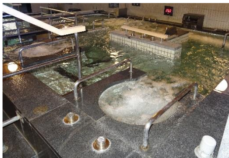
貸出画像「爽楽の湯」

人気の炭酸泉をはじめ、替り湯・ジェットバス・寝湯など、健康と美容にご利用いただきたいお風呂を取り揃えております。天井や浴槽を新調し、気分よく衛生的な温浴が楽しめます。