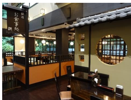
貸出画像「食事処 旬菜亭」

「稲城天然温泉 季乃彩」でも人気の食事処「旬菜亭」が、旬の素材を厳選し、豊富な食事メニューをお届けします。自然豊かなテラスでは「バケツジンギスカン」もご用意しております。手軽に楽しめるジンギスカンはビールとの相性も抜群です。専用のバケツを使用することで焼き始めるまでの時間はたったの5分、面倒な後片付けもスタッフが行いますので気軽にアウトドア気分が味わえます。