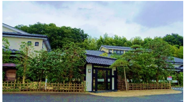
貸出画像「森乃彩外観」