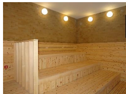
貸出画像「ドライサウナ」

「ドライサウナ」は大きな冷水風呂とセットでご利用いただけます。露天エリアには、スノコで寝そべて「整える」ゾーンもご用意しております。「よもぎ塩サウナ」はもくもく蒸気で蒸されたよもぎの香りでリラックスし、塩の作用で無理なく発汗することができます。