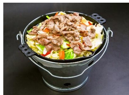
貸出画像「バケツジンギスカン(2人前)」