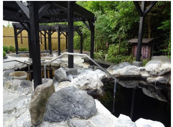
貸出画像「源泉かけ流しの露天風呂2」

多摩地区一帯で湧き上がる温泉の最大の特徴は【黒湯】です。古来、海の底に沈んでいた関東平野の海藻を含んだ地層から何億年という長い年月を経て湧出したロマンあふれる温泉です。黒湯の効果効能は、ミネラル成分における保温・保湿の美肌効果や皮膚疾患などと言われています。当店の温泉はとろみがありしっとり心地よい湯触りが特徴で、源泉かけ流しで鮮度の良い温泉が楽しめます。四季を映す森の自然を堪能し、都内でありながら温泉地に来たような気分が味わえる露天風呂です。