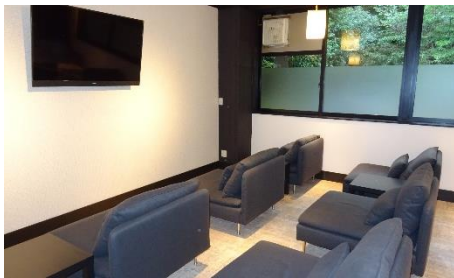
貸出画像「ゆったりラウンジ」

カフェ気分が味わえるゆったりしたソファの並ぶ「洋」を漂わせる空間で、テレビ鑑賞や読書が楽しめます。お連れ様とのお待ち合わせにもご利用いただけます。