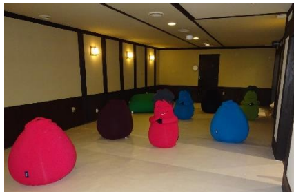
貸出画像「ぼかぼかの間」

床からぼかぼか、柔らかいクッションに身をゆだねられる、うたた寝空間です。テレビ音量や照明も抑え気味に設定し、リラククスできる環境です。