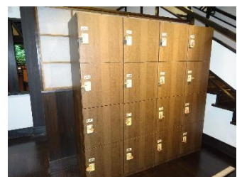
貸出画像「ランナー専用ロッカー」

森乃彩の裏山には町田市の小山内裏公園まで続く、全長6.5キロの尾根緑道があります。この遊歩道では多摩丘陵の自然を感じながらウォーキングやランニングなどが楽しめます。森乃彩から尾根緑道までは徒歩約4分の距離にあり、館内にランニングステーション専用ロッカーをご用意します。運動の後はお風呂で汗を流し、3種類の休憩所で身体を休めることができます。