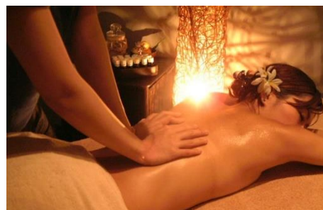
貸出画像「エステ処「排毒屋」」

全身オイルトリートメントからフェイシャルまでオールハンドで施術いたします。頑張っている自分へのご褒美、至福のひと時をお過ごしいただけます。