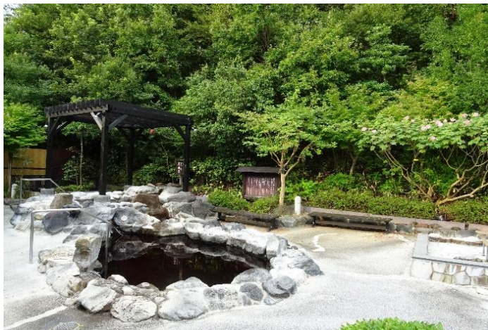
源泉かけ流しの露天風呂