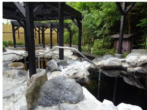
源泉かけ流しの露天風呂

四季を映す森の自然を堪能し、都内でありながら温泉地に来たような気分が味わえる露天風呂です。