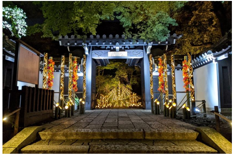
貸出画像「竹あかり×聖門」

「花灯小路(はなあかりこみち)」と名付けられたHANAあかりのメインエリアでは、竹あかり演出集団「CHIKAKEN(ちかけん)」が、約300本の竹あかりと京都御所からの移築とされる文化財「聖門」のライトアップをプロデュースします。さらに聖門を抜けた先では、「花灯小路」のメインオブジェ「花灯火(はなともしび)」をご覧ください。