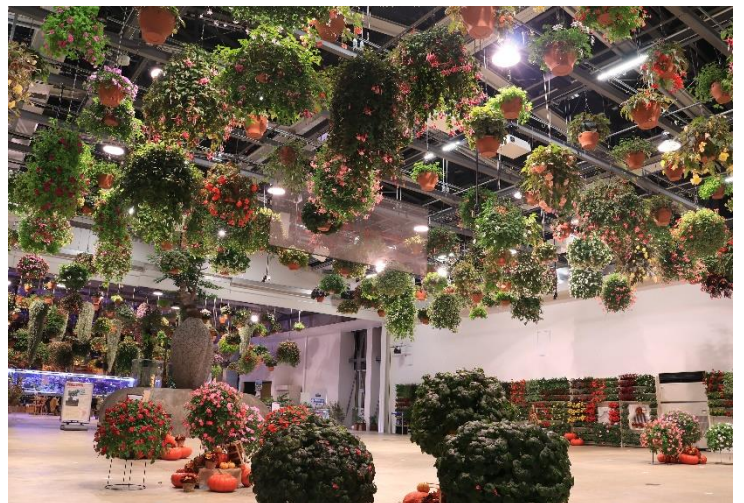
貸出画像「フラワーシャンデリア」

HANAあかりBIYORI館では、日本最大級の300鉢を超えるフラワーシャンデリアがライトアップされた姿をご覧ください。太陽の光を浴びて輝く昼とは違った姿を見せる、夜のフラワーシャンデリアも必見です。