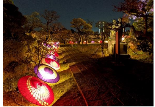
貸出画像「和傘ライトアップ」

聖なる森エリアは一部を開放し、文化財と和傘のライトアップをおこないます。ライトアップされる八祖師像と多宝塔、周囲を囲むように展示される和傘のライトアップの幻想的な雰囲気を感じてください。