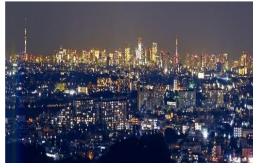
貸出画像「東京大夜景」

空見の丘(見晴台)からは東京を代表する観光名所「スカイツリー」や「東京タワー」、新宿の高層ビル群など、都心の絶景が一望できます。夜の営業では、冬の澄んだ空にきらめく東京の大夜景をお楽しみください。