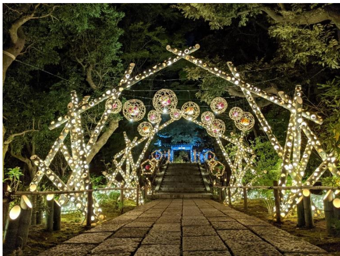
貸出画像「花灯小路」