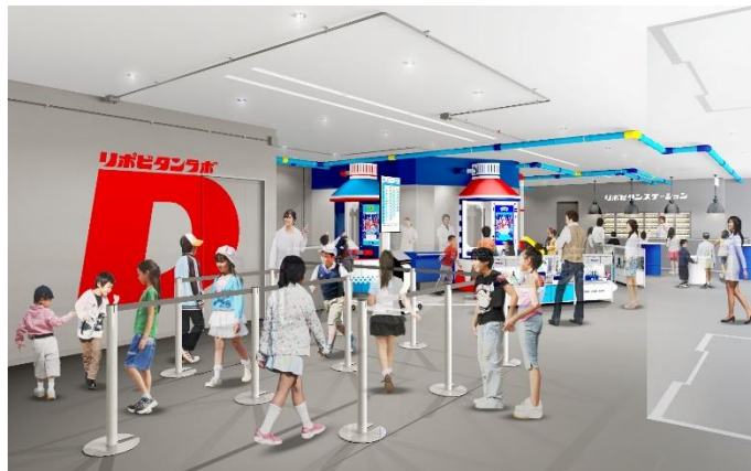
貸出画像「リポビタンラボ～リポ博士とヒミツの研究～」