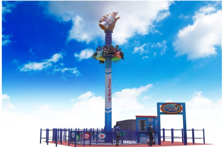
貸出画像「ファイト イッパーツ！」