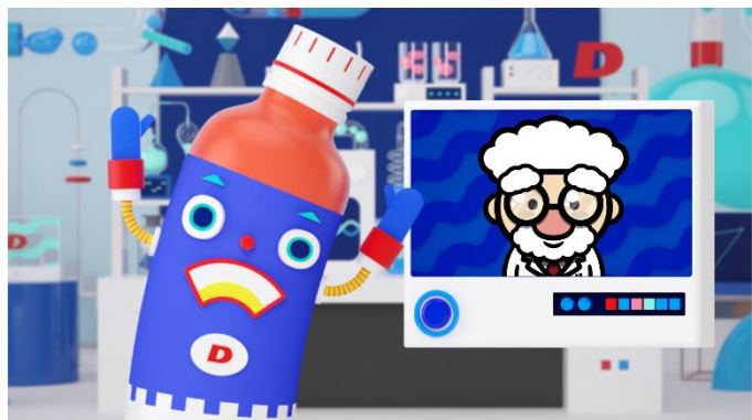
貸出画像「リポ博士と打錠機のダ・ジョン」