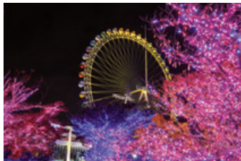
黄金に輝く「大観覧車」