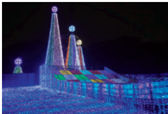
高さ最大25mのグラン・オブジェ