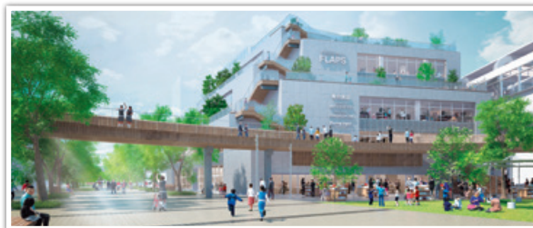
流山おおたかの森S・C FLAPS 外観イメージ

2021年春、千葉県流山市の「流山おおたかの森」駅至近にグランドオープンする商業施設「流山おおたかの森S・C FLAPS」（東神開発株式会社）内に、親子に人気の室内あそび場「キドキド」と世界のあそび道具を販売する「ポーネルンドショップ」を併設した親子向け屋内施設「ポーネルンドあそびのせかい 流山おおたかの森店」を新規出店いたします。当社としては、フランチャイズ4店舗目の運営となります。