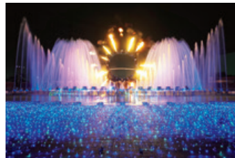
大迫力の噴水ショー