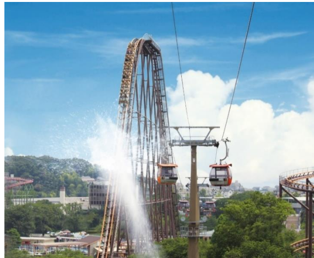
貸出画像「爽快MAX! スプラッシュバンデット2021①」