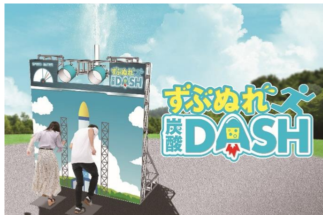
貸出画像「ずぶぬれ炭酸DASH」