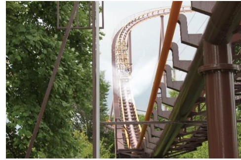
貸出画像「爽快MAX！スプラッシュバンデット2021」

「いたずらスプラッシュキャノン」はフットパネルにより発射できるので、接触を気にせずに安心して楽しめます。乗っても乗らなくても爽快感を味わえる、大満足のアトラクションです。