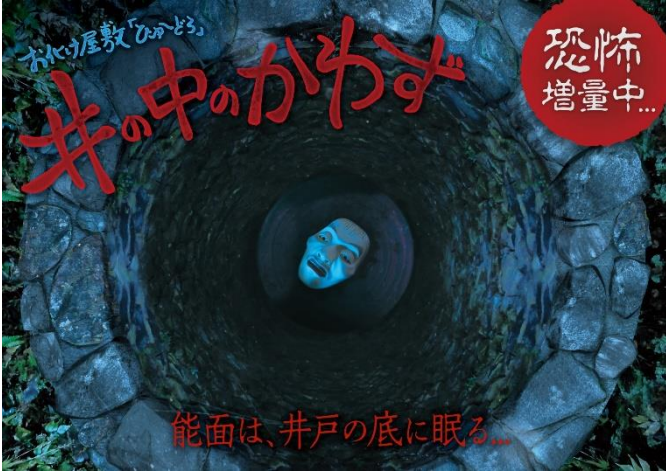
貸出画像「井の中のかわず 恐怖増量中」

お化け役のアクターも登場してお客様を恐怖のどん底に突き落とし、体の芯からひんやりするアトラクションです。