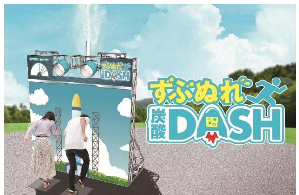
貸出画像「ずぶぬれ炭酸DASH」