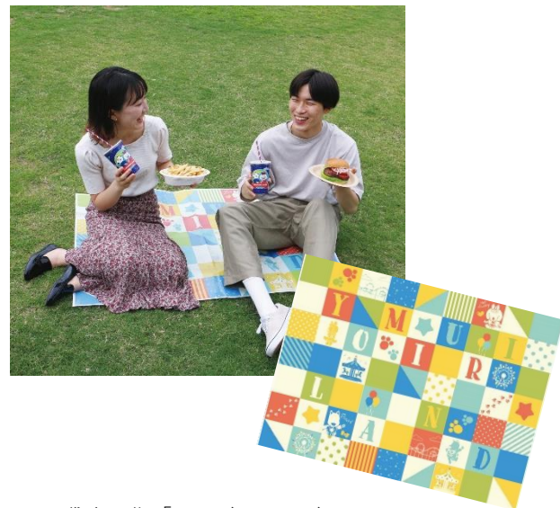
貸出画像「オリジナルレジャーシート」