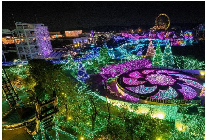
貸出画像「ジュエルミネーション(昨年の様子)」