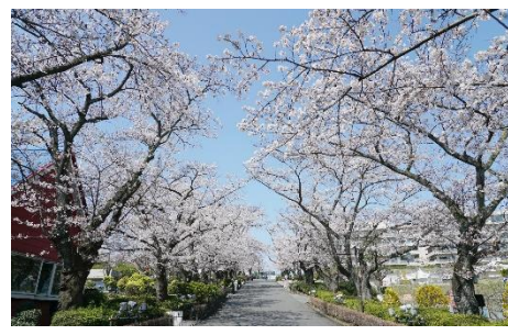
貸出画像「桜並木(一昨年の様子)」

京王よみうりランド駅と入園口を結ぶゴンドラから眺める満開の桜は、まるでピンクのじゅうたんの上を飛んでいるよう! (片道: 300円、往復500円)