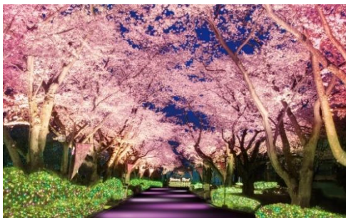
貸出画像「桜並木ライトアップ(イメージ)」

桜のイメージを強調するような薄いピンクのライトアップで演出します。夜桜とジュエルミネーションが一度に楽しめる一押しスポットです。