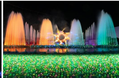
貸出画像「噴水ショー」

メインシンボルでもある大観覧車は、上部を「希望や生きるエネルギー」を表現する金色、下部を「生命の輝き」であるエメラルドグリーンで照らします。