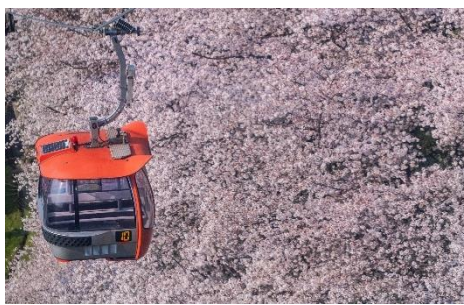
貸出画像「ゴンドラスカイシャトル(昨年の様子)」

人気No.1のジェットコースター「バンデット」は、“お花見コースター”に大変身! 最高地点で桜を見下ろしたと思ったら、猛スピードで桜の中を駆け抜けます。