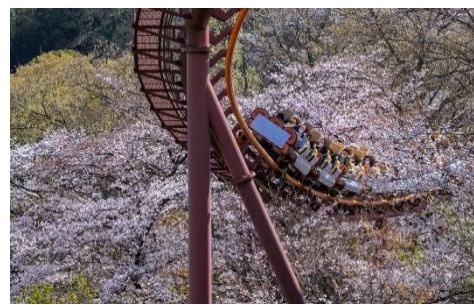
貸出画像「バンデット(昨年の様子)」

人気No.1のジェットコースター「バンデット」は、“お花見コースター”に大変身! 最高地点で桜を見下ろしたと思ったら、猛スピードで桜の中を駆け抜けます。