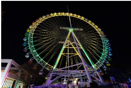
貸出画像「希望のグランオブジェ」

桜のイメージを強調するような薄いピンクのライトアップで演出します。夜桜とジュエルミネーションが一度に楽しめる一押しスポットです。