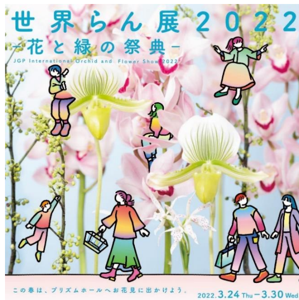
貸出画像「世界らん展2022キービジュアル」

HANA❀BIYORIでは、「遊園地・テーマパークにおける新型コロナウイルス感染拡大予防ガイドライン」