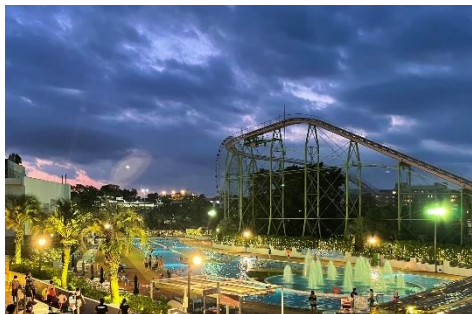
貸出画像「ナイトプール①」

ナイトプールとして都内屈指の規模を誇り、4つのプールや3つのスライダーで日焼けを気にせず思い切り遊べると好評です。ライトアップやイルミネーションなどの演出で、海外のリゾート地を訪れたような開放的な気分も楽しめます。チケットは17時以降入場できる特別価格で販売します。