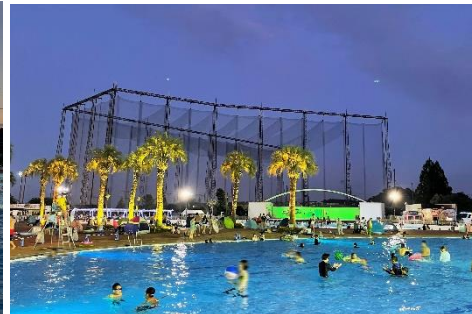
貸出画像「ナイトプール③」

〔開催日〕7月16日(土)～31日(日)の土日祝日、8月5日(金)～31日(水)、9月3日(土)、4日(日) 計36日間