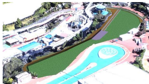
貸出画像「新休憩エリア(イメージ)」