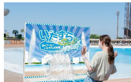
貸出画像「いたずらスプラッシュ!! イメージ」