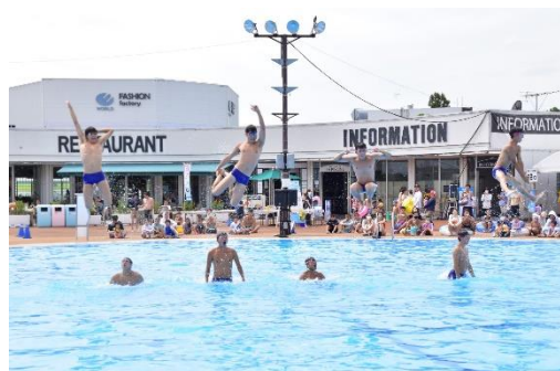
貸出画像「シンクロショー②」