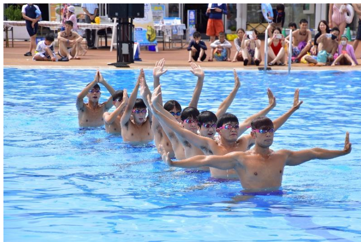
貸出画像「シンクロショー①」

よみうりランドでは、「遊園地・テーマパークにおける新型コロナウイルス感染拡大予防ガイドライン」を踏まえ、新型コロナウイルス感染拡大防止対策に努めます。