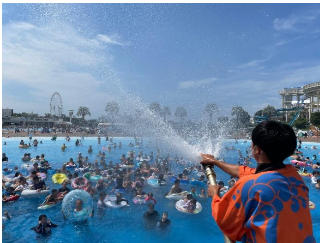
貸出画像「ステージからの放水」