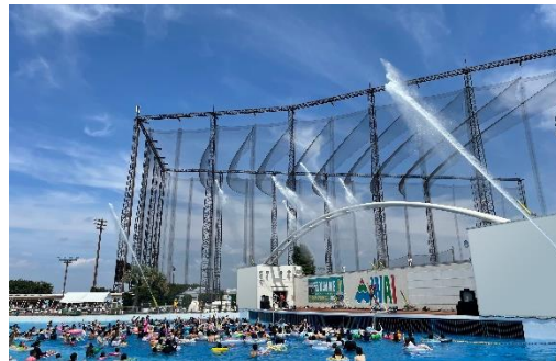
貸出画像「放水イメージ」