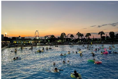
貸出画像「ナイトプール②」