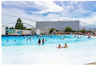
貸出画像「波のプール」