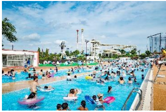
貸出画像「流れるプール」