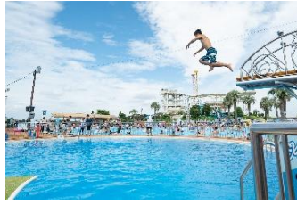
貸出画像「ダイビングプール」

3つの高さから飛び込める、泳ぎを存分に楽しめる 本格的なダイビングプール。 広々としたプール。