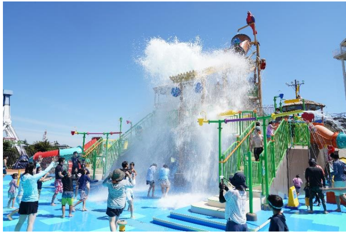
貸出画像「わいわいジャングル」