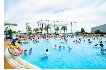
貸出画像「スイミングプール」