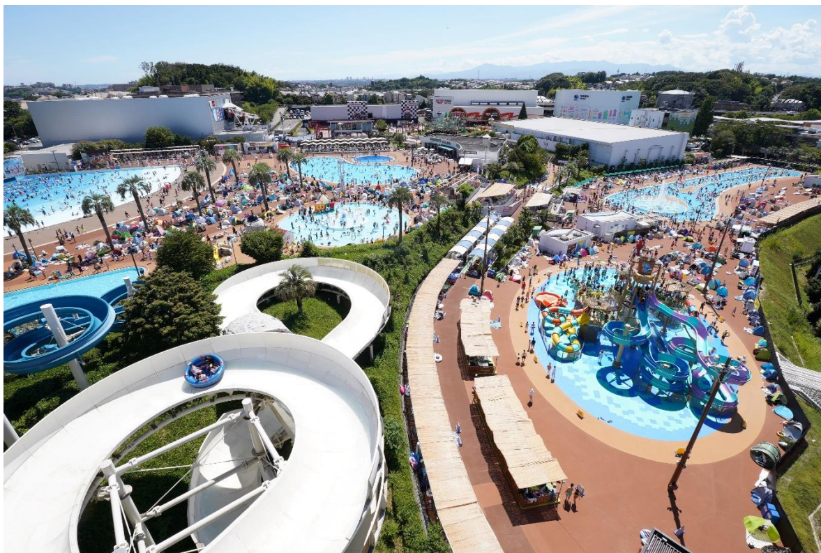
貸出画像「よみうりランド プールWAI全景(昨年の様子)」

(※)期間中の営業日は、公式サイト( https://www.yomiuriland.com/wai/ )をご確認ください