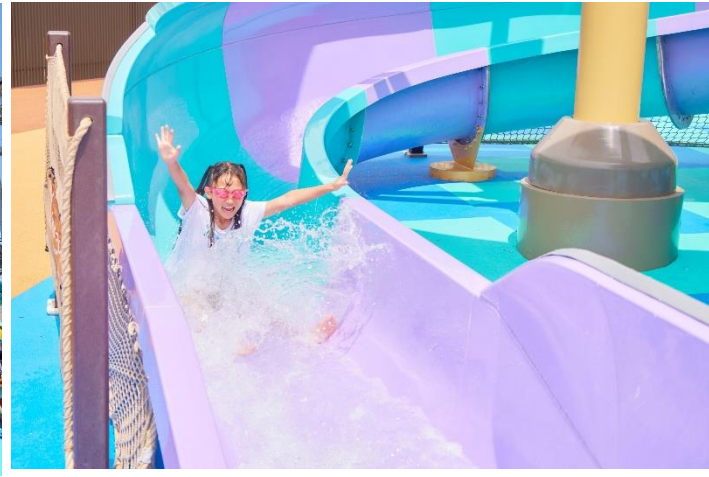
貸出画像「わいわいジャングル パープルスライダー」