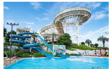
貸出画像「スライダー3種」