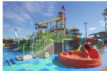
貸出画像 ※左から 「ブルースライダー・ パープルスライダー」 「イエロースライダー・ オレンジスライダー」 「レッドスライダー」