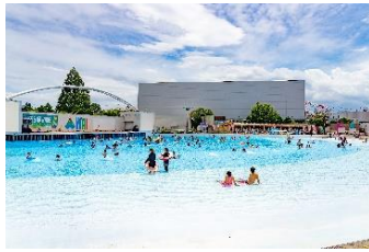
貸出画像「波のプール」