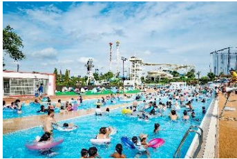
貸出画像「流れるプール」