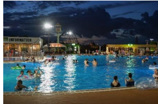
貸出画像「ナイトプール」