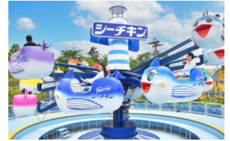
貸出画像「シーチキンGO!」