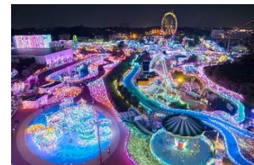
貸出画像「ジュエルミネーション全景 ※画像はイメージです」