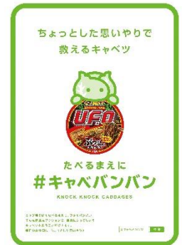
貸出画像「たべるまえに#キャベバンバン」