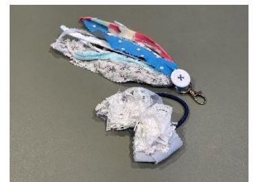
貸出画像「フラワーシュシュとラッキータッセル」

○ペットボトルのキャップでコースターをつくろう。 supported by KIRIN