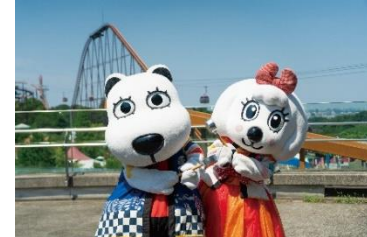
貸出画像「打ち水イメージ」