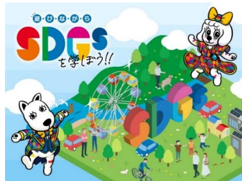
貸出画像「遊びながらSDGsを学ぼう!!」

( https://yomiuriland.co.jp/sustainability/ )