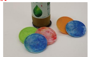
貸出画像「キャップでつくったコースター」