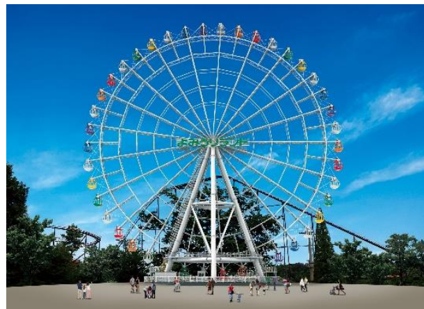
新観覧車「Sky-Go-LAND」昼の様子(イメージ)