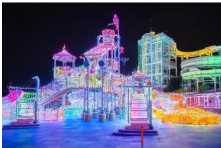
「ラプリー・サンクチュアリ」(昨年の様子)