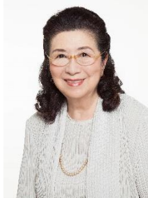
貸出画像「石井幹子氏」

2000年に照明デザインへの貢献により、紫綬褒章を受章。2019年に文化功労者、2020年には名誉都民に選ばれ、2023年に旭日中綬章を受章。国内外での受賞多数。