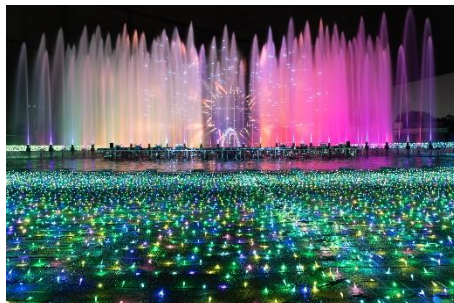
噴水ショー(昨年の様子)