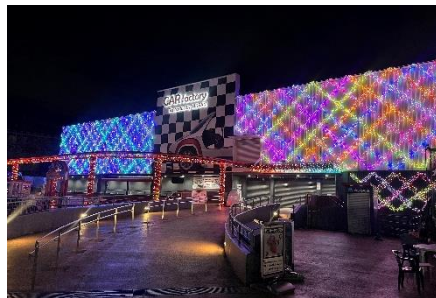
「エターナル・グリッド」