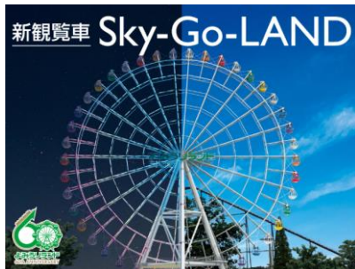
新観覧車「Sky-Go-LAND」(イメージ)

今年は、新色「ダイヤモンド・ジュエリーカラー」や開園60周年を祝うスポットが新たに登場します。点灯式では、ゲストにタレントのおのののか氏と競泳 塩浦慎理選手夫妻、お子様をお迎えしてイルミネーションに関するトークをお届けします。高さ15mの巨大リングのウォータースクリーン映像や238本の噴水、レーザーと炎で大迫力の噴水ショーも披露されます。