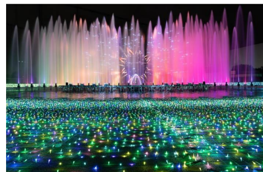
「噴水ショー」(昨年の様子)

毎年大人気の噴水ショーを今年も「波のプールエリア」で開催します。高さ15mの巨大リングのウォータースクリーン映像や238本の噴水、レーザーと炎による演出で圧倒的なスケールでお届けするショーは必見です。今年も、「ジュエル・フェスティバル」のほか、2種の噴水ショーが楽しめます。