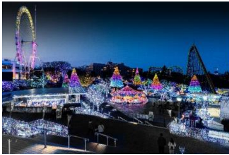
「ダイヤモンド・ジュエリーカラー」(イメージ)