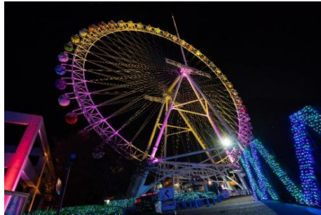
「大観覧車」(昨年の様子)

今シーズン限りの最大のスポットは、2基の観覧車がジュエリーカラーのテーマで輝きを放ちます。大観覧車は「LIGHT is LOVE」をテーマにゴールドとピンクに、「Sky-Go-LAND」はジュエルミネーション® 開催当初からの14種類のジュエリーカラーイルミネーションをパレードのように次々に点灯します。※大観覧車は2025年1月13日までの運行となります。園内では、グッジョバやパサージュのデザインを一新し、祝祭感溢れる輝きでいっぱいです。