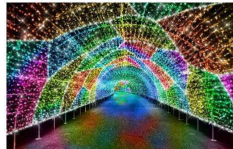
「クリスタル・パサージュ」(イメージ)