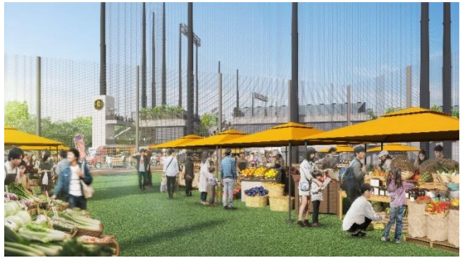
マルシェやお祭りなど、幅広い活用が想定されている（イメージ）

その後も巨人の新たなファーム本拠地としてイースタン・リーグ公式戦を年間約 60 試合開催し、またアマチュア野球や女子ソフトボール、スポーツやカルチャー教室、マルシェ、地域のお祭り、謎解き体験型イベントの「リアル脱出ゲーム」、ランニングイベント、様々な手仕事の逸品を集めた「クラフトフェスティバル」など野球以外のエンターテインメントでの幅広い活用を予定しています。さらに、野球の試合やイベントがない日には、近隣の皆様が公園のように散策できるよう、球場を一周できるコンコースや内外野のスタンドを一般開放します。コンコースには常設と、期間限定で入れ替わる飲食売店を各 1 店舗営業し、客席に座って食べることができるほか、芝生の外野席ではピクニックのようにお弁当を広げて食べることができ、年間を通してにぎわうエリアを創出します。