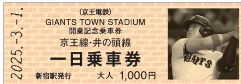
D型硬券乗車券デザイン

(6)乗車券の有効期限 3月1日(土)～8月31日(日) ※いずれの乗車券も利用当日限り有効