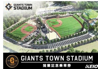
特製台紙 表紙デザイン