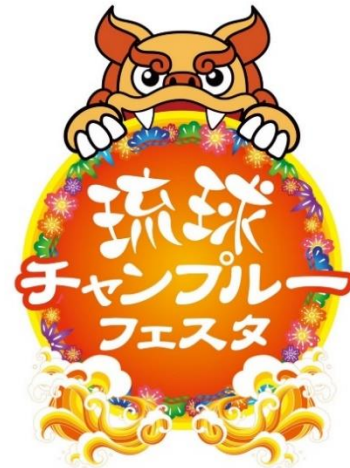
貸出画像「琉球チャンプルーフェスタ」

競馬ファンだけでなく地域の方々にも愛される、賑わいある施設へと進化する船橋競馬場にぜひ足をお運びください。