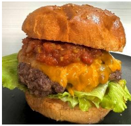
貸出画像「石垣牛100%バーガー」

ゴーヤーチャンプルーや石垣牛バーガーなど沖縄を代表するフードが勢ぞろい。「沖縄そば」は様々な種類を食べ比べることができます。またオリオンビールや泡盛、フルーツジュースなど、沖縄を堪能できるドリンクメニューも豊富です。